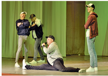
Команда «Завод» (Башкирская содовая компания, г. Стерлитамак) и болельщики из БСЗ