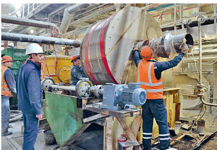
Во время капитального ремонта оборудования успех работы на 99% зависит от слаженности и профессионализма команды

В отделении кальцинации цеха кальцинированной соды №2 – в самом разгаре капитальный ремонт барабанного ячейкового вакуум-фильтра №3.