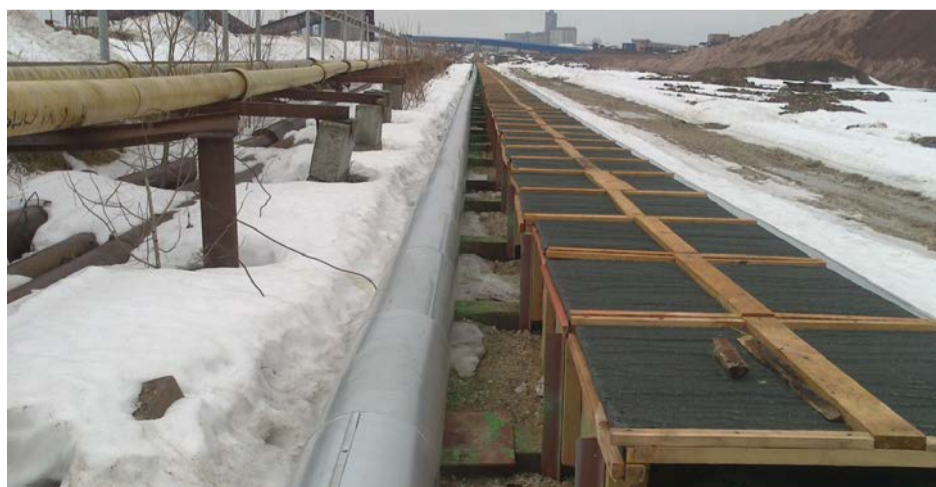
Пульпопровод в защитном коробе

требующее высоких затрат на ремонт и эксплуатацию.