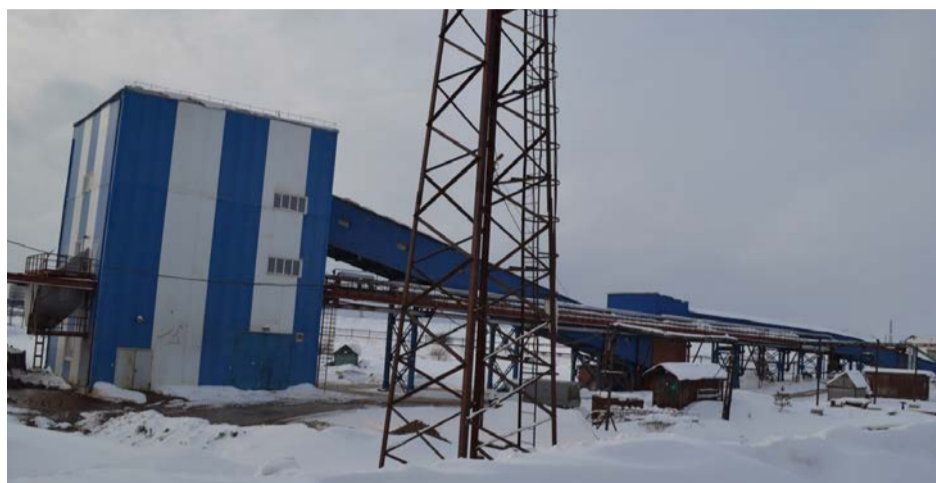
Узел приготовления пульпы с конвейерным трактом